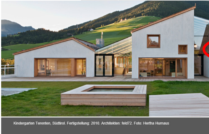
Kindergarten Terenten, Südtirol. Fertigstellung: 2010. Architekten: feld72.